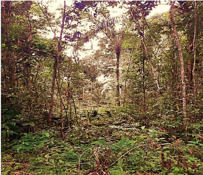
Figura 3: Área desmatada próximo ao fragmento florestal do Instituto Federal de Educação, Ciência e Tecnologia do Amazonas – IFAM campus Maués, 2019.

Trabalhos relacionados com educação ambiental são de extrema importância, apesar de pouco realizada em escolas, essa prática tem o objetivo de conscientizar a população local e alertar para a importância, preservação e perda da fauna e flora regional (SOUSA et al., 2013; ZANG et al., 2019). Dentre os insetos com potencial para uso em programas de monitoramento ambiental, as principais espécies pertencem às ordens Coleoptera, Diptera, Hemiptera, Hymenoptera, Lepidoptera e Orthoptera (BROWN, 1997). Esses insetos destacam-se pelo papel que desempenham no ecossistema: a ciclagem de nutrientes, a decomposição, a produtividade secundária, a polinização, o fluxo de energia, a predação, a dispersão de sementes, a regulação das populações de plantas e de outros organismos (PRICE, 1984), também são abundantes, relativamente fáceis de serem coletados e de fácil manuseio (RAFAEL, 2002).