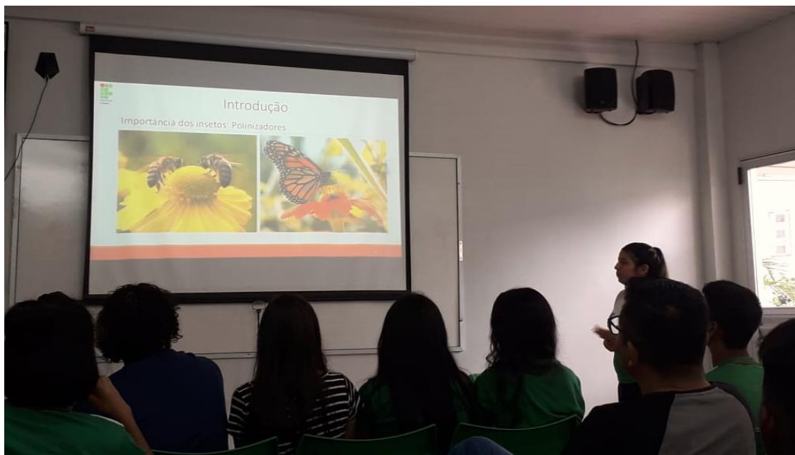
Figura 4: Palestra sobre a importância dos insetos no ecossistema, ministradas para discentes e docentes do Instituto Federal de Educação, Ciência e Tecnologia-IFAM campus Maués, 2019 (Fonte: Silvia Leticia Michiles Aguiar).

exposições com a coleção entomológica montada através dos insetos coletados no fragmento florestal do IFAM. Essa prática teve uma ampla participação dos discentes e docentes, com perguntas sobre a morfologia, interações biológicas, lendas e curiosidades dos insetos. Nessa atividade foi demonstrada a diversidade de insetos presentes no fragmento e sua importância para o meio ambiente.