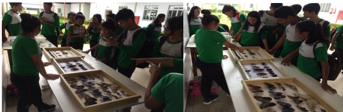
Figura 5: Exposição da coleção entomológica para os discentes e docentes do Instituto Federal de Educação, Ciência e Tecnologia-IFAM campus Maués, 2019.